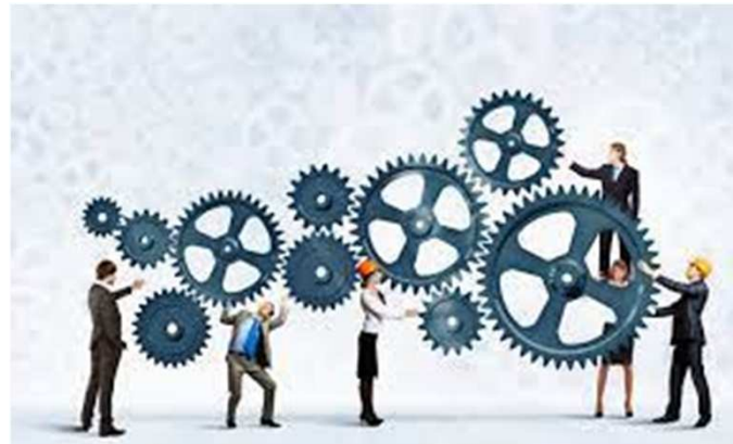
Pautas para orientar y alinear a los equipos