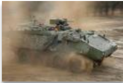
Wheeled Armored Vehicles